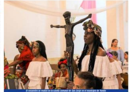
El recorrido de historia de la casa comunal de San Jorge en el municipio de Yumbú.