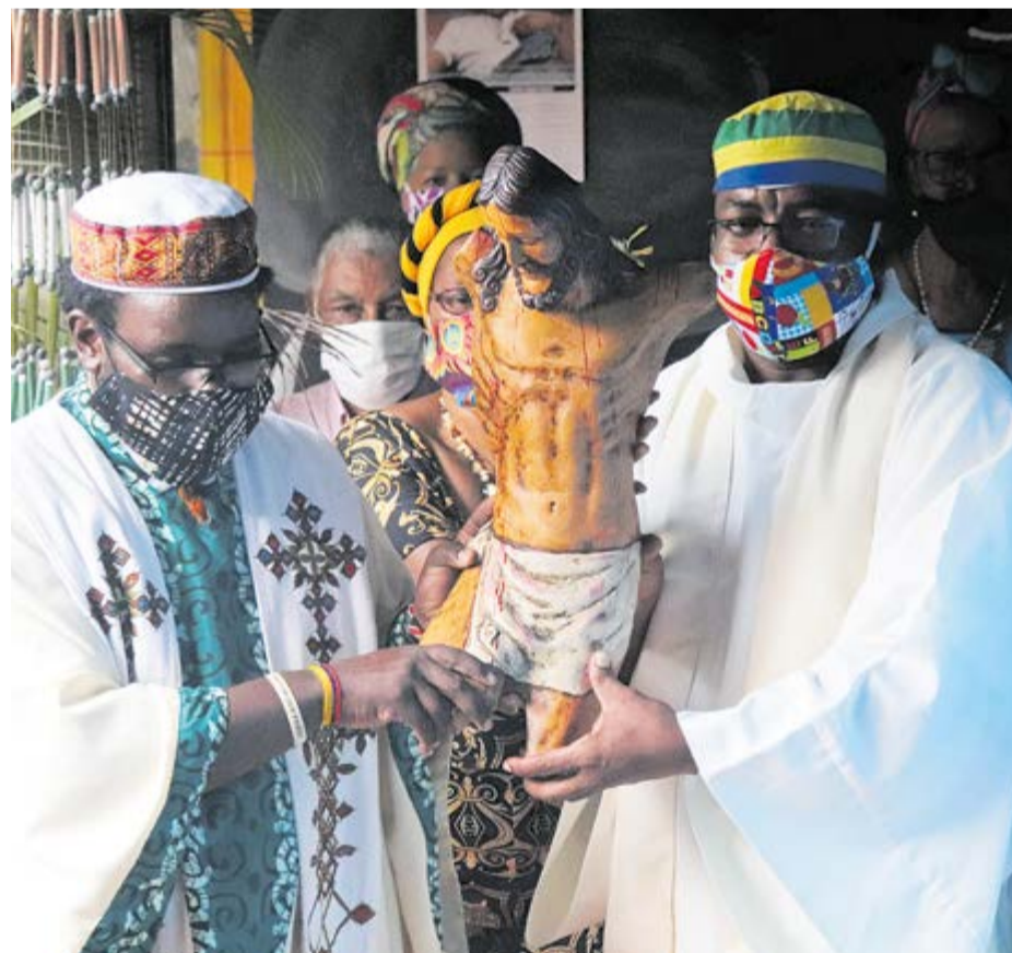
La Pastoral afro le apuesta a la riqueza espiritual y cultural del pueblo afrocolombiano